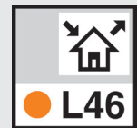
Kontrolle des automatisch vorgeschlagenen Lüftungssystems mit Möglichkeit für manuelle Änderung. Die Norm-Kennzeichnung wird sofort mitgeführt.

Programm zum komfortablen Berechnen lüftungstechnischer Maßnahmen nach DIN 1946-6 und Konventionen des FGK e. V. unter Berücksichtigung der bauphysikalischen, hygienischen, energetischen und lüftungstechnischen Eigenschaften eines Gebäudes. Lüftungsmöglichkeiten mit ihren Auswirkungen auf das Lüftungskonzept lassen sich schnell, einfach und sicher in wenigen Schritten darstellen, insbesondere für komplexe nicht in der Norm abgebildete Mischsysteme. Vielseitiger Datenverbund mit EnEV, TGA und CAD.